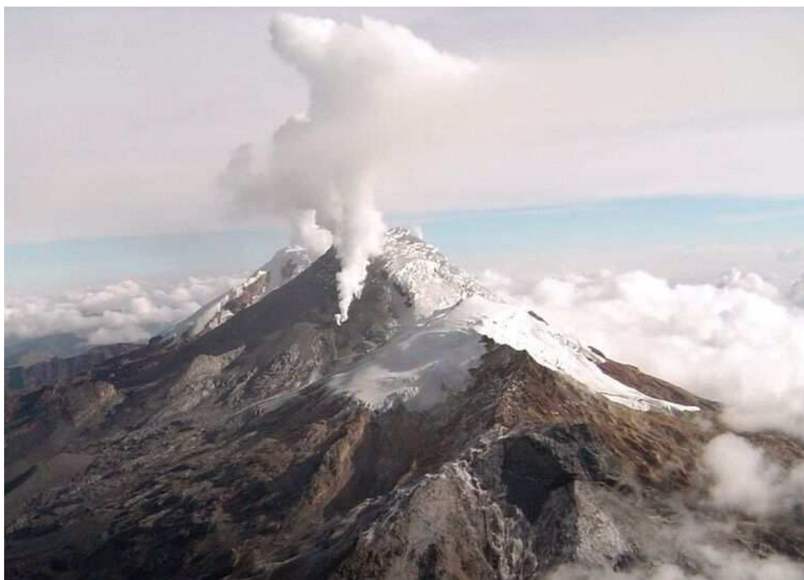
Imagen 1: Fotografía del VN del Huila, de febrero 26 de 2007: se aprecia la actividad fumarólica anunciando la reactivación del volcán.

La ocurrencia de flujos de lodo catastróficos asociados a la erupción del Volcán Nevado del Huila ocurrida la madrugada del pasado 18 de abril, y comparable al conocido evento ocasionado por un sismo de magnitud 6,4 ocurrido en 1994 con epicentro cercano al volcán y que dejó unos 1.100 muertos, ha llamado la atención esta vez, porque no se han presentado víctimas humanas mortales, asunto que muestra de manera inequívoca la capacidad de una comunidad indígena sólida y organizada en virtud del fuerte tejido social que la caracteriza, y también los beneficios pedagógicos y materiales de la reconstrucción física que se hizo después del desastre del Páez, ocurrido por el sismo anotado.