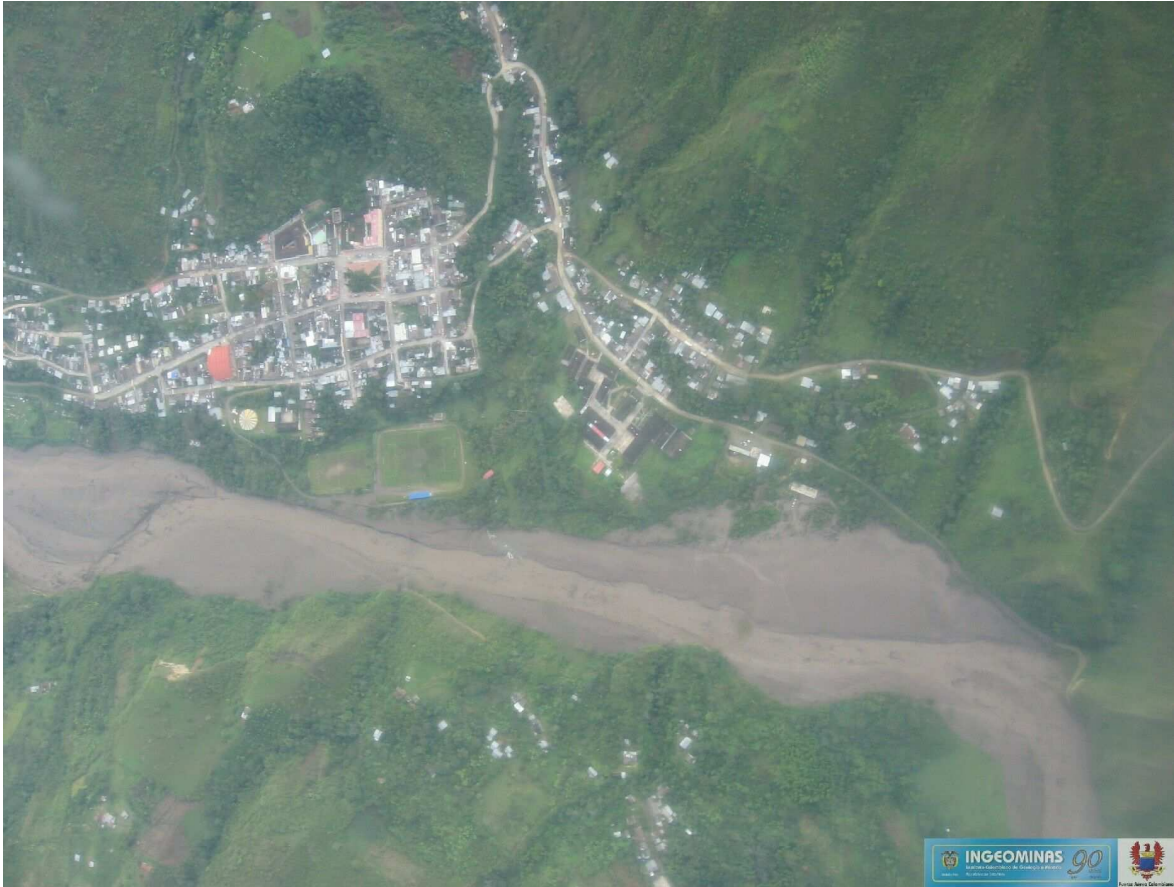
Imagen 3: Efectos de la erupción del 18 de abril: las poblaciones más afectadas han sido Belalcázar e Inzá en el departamento del Cauca, y Tesalia en el departamento del Huila. Solamente en la localidad ribereña de Belalcázar, cerca de 3.000 habitantes se han desplazado a la parte alta de la montaña.

Lo anterior se traduce en incertidumbres, angustias, dificultades y necesidades, como también en decisiones de la comunidad indígena de Tierradentro pensadas y adoptadas desde su cosmogonía y saberes, a través de la Asociación de Cabildos NASA ÇXHÂÇXHA.